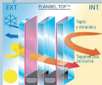
Izolační trojsklo s Planibelem TOP N+

U_g=0.5 \text{ W/(m}^2\cdot\text{K)} SF=47%